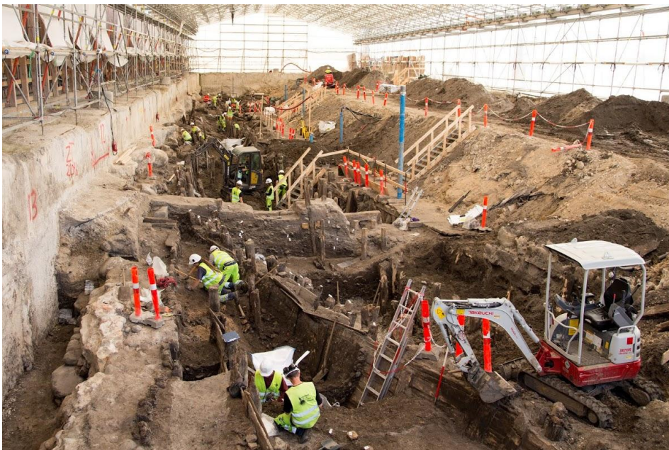
Udgravning af havneanlæg ved Gammel Strand, 2014.

Projektet gennemføres over en periode på 4 år med start fra 1. januar 2016 i et samarbejde mellem de tre gravende institutioner Københavns Museum (KM), Odense Bys Museer (OBM) og Statens Historiska Museer (SHM) samt deres tilknyttede samarbejdspartnere Bohusläns Museum, Göteborgs Stadsmuseum, Rio Göteborg Natur- og kulturkooperativ og Skoletjenesten. Forskningen vil ske i tæt samarbejde med Center for Urban Networks (Urbnet) ved Institut for Kultur og Samfund på Aarhus Universitet (IKS).