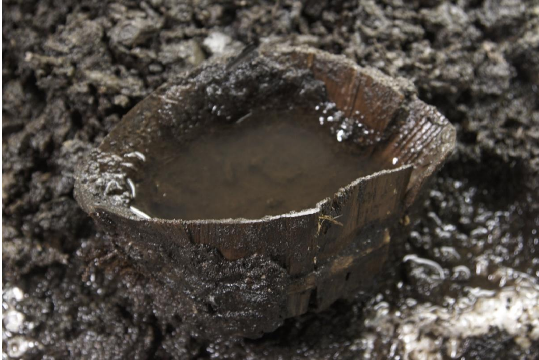
Stavbæger fra Odense, ca. 1400.