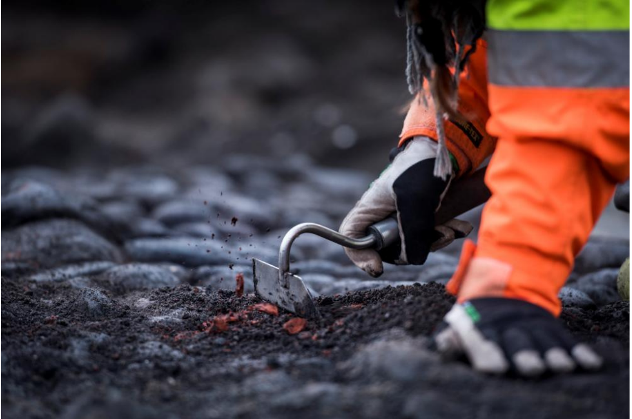
Udgravning i Nya Lödöse, 2014.