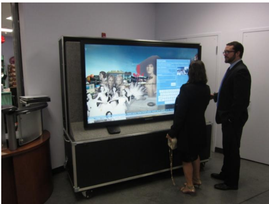
Den mobile version af Digital Wall, El Paso, februar 2015. KM var konsulenter på projektet, som er en videreudvikling af den københavnske VÆG. På grund af KMs intellektuelle ejendomsret til VÆGGEN kan løsningen etableres forholdsvis enkelt i DK.