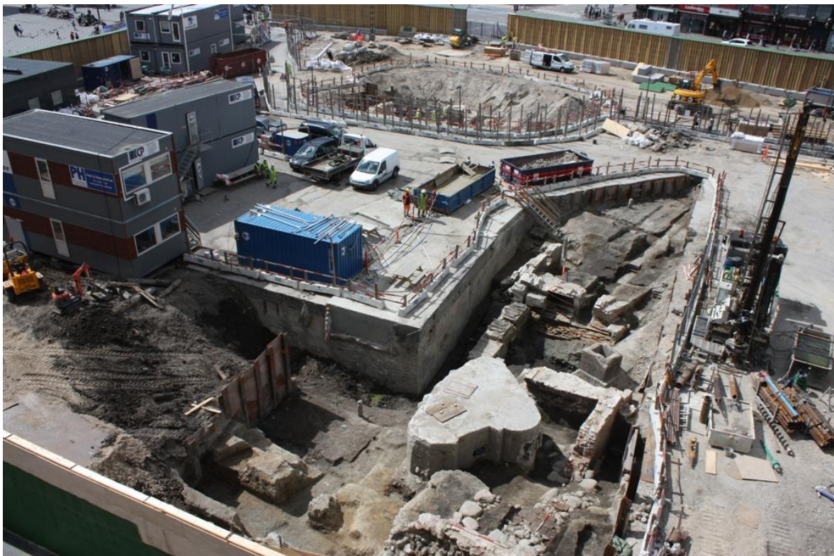
Udgravning på Rådhuspladsen, 2012.

Det arkæologiske kildemateriale, som udgravningerne har frembragt, er som nævnt både omfattende og mangesidigt, ligesom det forhold, at alle fund er grundigt kontekstualiserede og indsamlet ud fra en målrettet prøvetagningsstrategi giver særligt gunstige muligheder for at applicerer ovenstående teoriapparat på materialet. De mange kontekstuelle relationer giver med inddragelse af naturvidenskabelige analyser og skriftligt kildemateriale mulighed for at spore konkrete processer eller kæder af hændelser og relationer, der giver information om migration, mobilitet, urbane møder og identiteter. I det følgende skitseres tre eksempler fra udgravningerne, som tilsammen giver et billede af metodens muligheder.